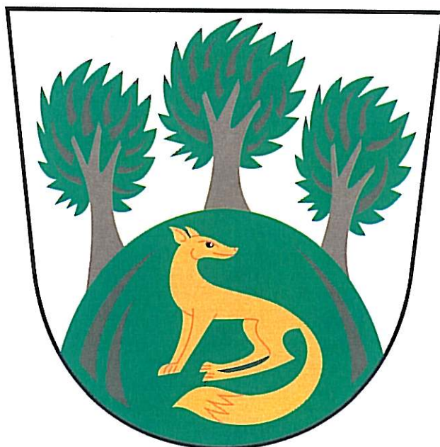
Znak obce Vícenice