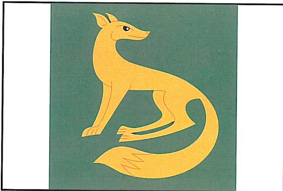
Vlajka obce Vícenice